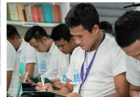
▲11月11日、12日フィリピンにて