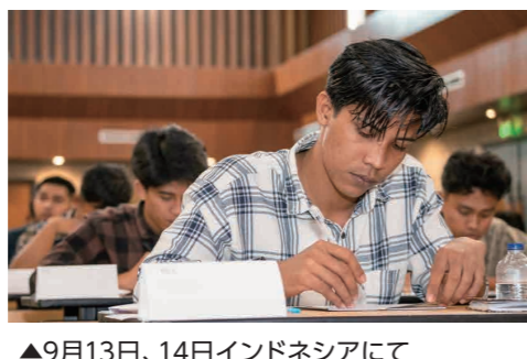
▲9月13日、14日インドネシアにて