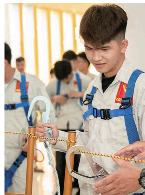
▲10月14日、15日ベトナムにて