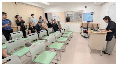
▲日本語講座(もじとことば) オンライン講義の様態を見学