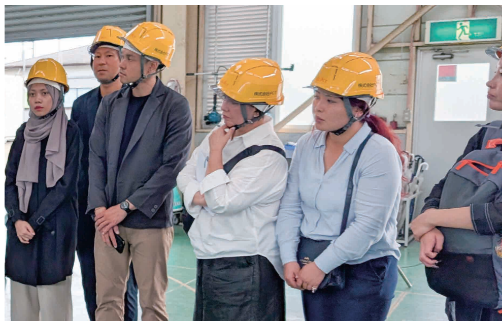
▲ガス溶接技能講習(インドネシア語) 実技を見学