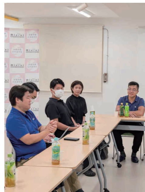
▲日本語講座講師と交流