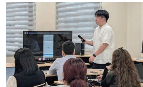
▲JACメンバーズアプリ操作実演